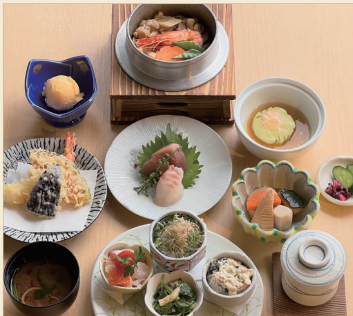
こじまのおすすめ料理を味わえるコース