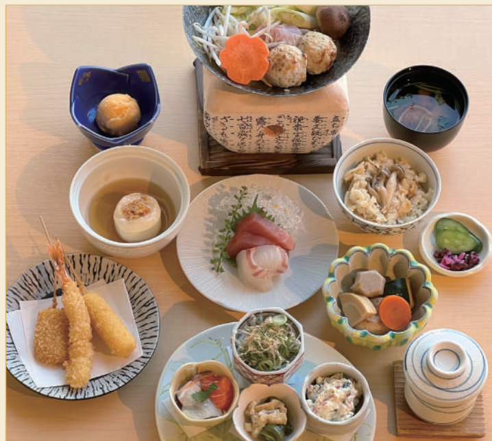
この時期のご宴会を盛り上げる鍋コース