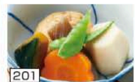
201 煮物 150円