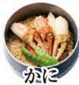
かに セット 307 単品 308