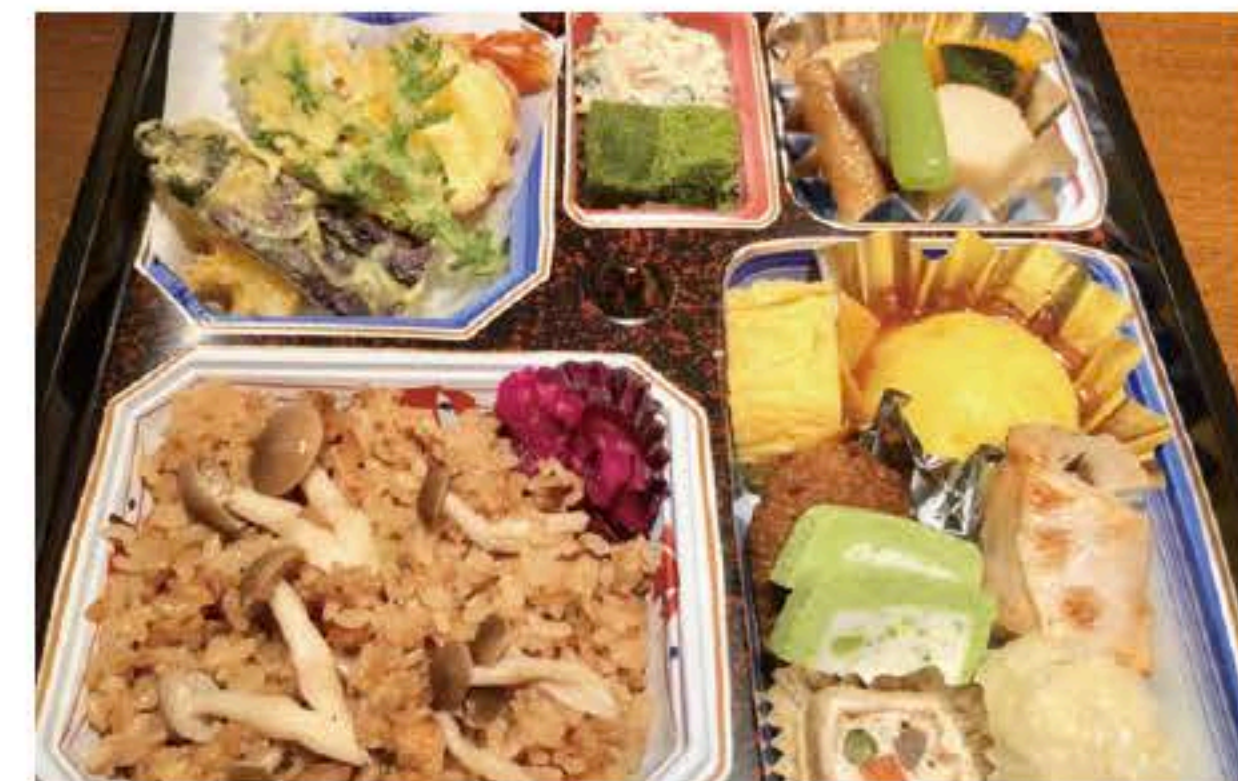
004 季節の松花堂弁当 1,500円

天ぷら(海老、なす、春菊、さつまいも)、煮物(里芋、がんも、カボチャ、にんじん、 こんにゃく)、玉子焼き、つくね焼き、焼魚(鮭)、白和え、あんかけ饅頭、お新香、 しめじの炊き込みご飯