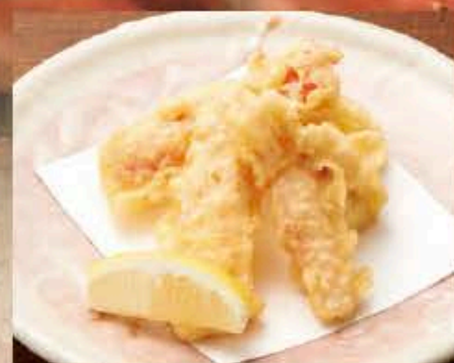
502 タラバガニの天ぷら 900円