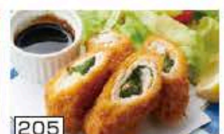
205 チキンチーズ大葉巻 450円