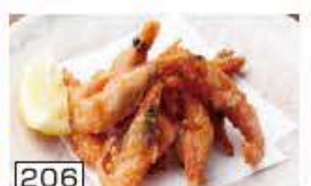
206 甘エビ唐揚げ 450円