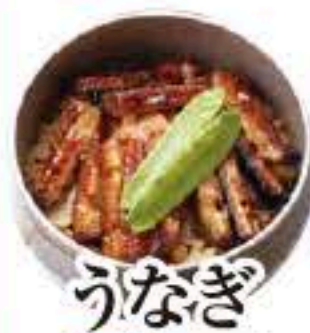
うなぎ セット 317 単品 318