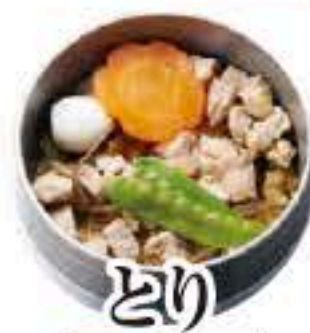
とり セット 305 単品 306