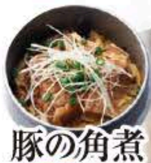
豚の角煮 セット 319 単品 320