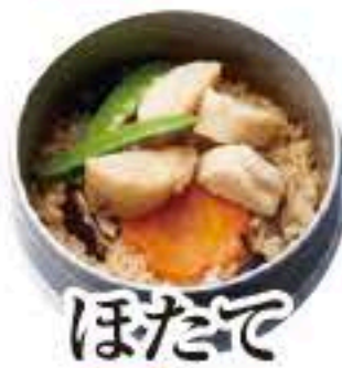
ほたて セット 311 単品 312