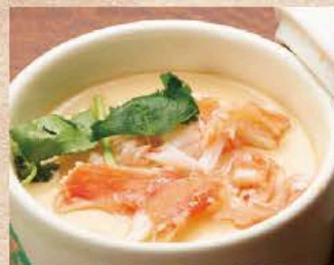
504 タラバガニとモッツアレラ チーズの茶碗蒸し 300円