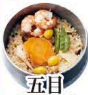
五目 セット 301 単品 302