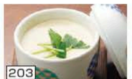
203 茶碗蒸し 150円