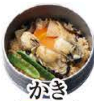
かき セット 303 単品 304