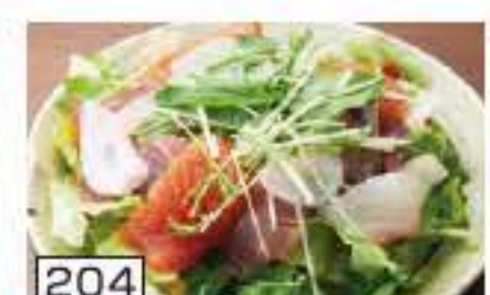
204 海鮮サラダ 750円