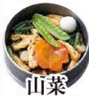
山菜 セット 309 単品 310