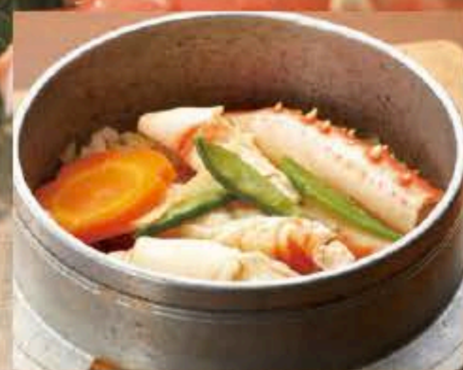
501 タラバガニ釜めし 1,500円