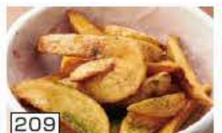
209 ポテトフライ 450円