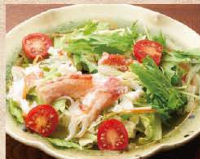
503 タラバガニのサラダ 700円