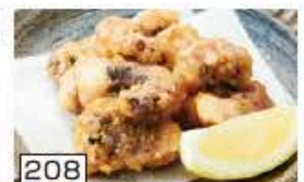
208 たこ唐揚げ 450円