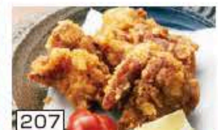
207 唐揚げ 450円