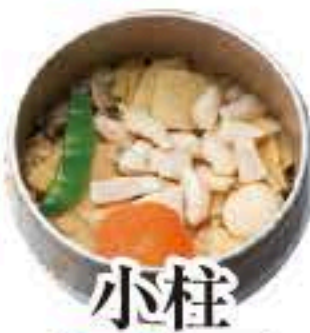
小柱 セット 315 単品 316