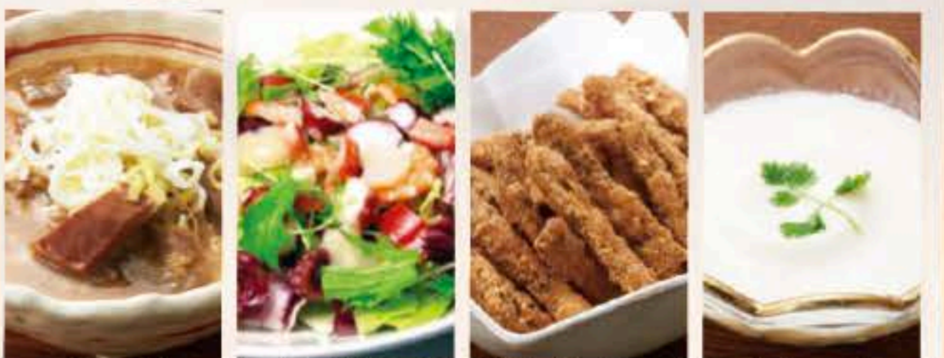
もつ煮 こじまサラダ うなぎの骨せんべい 杏仁豆腐

1回のご注文につき5,000円ご利用ごとに下記からお好きなものを1つプレゼント! ※10,000円で2つ、15,000円で3つお選びいただけます!(最大10個まで)