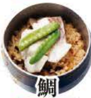
鯛 セット 313 単品 314