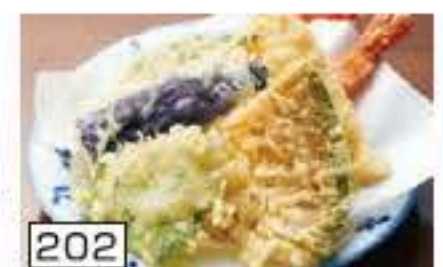
202 天ぷら盛合せ 750円